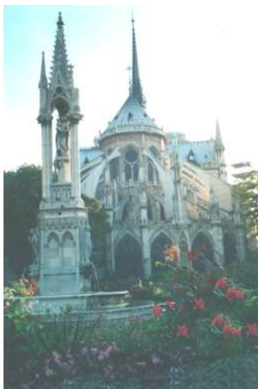
Восточный фасад Собора, 2000 г.

К 2000 году собор почистили. До того он был темным, серым от копоти.