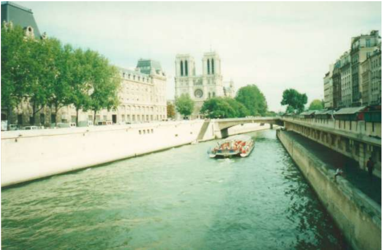
Вид на Собор со стороны реки