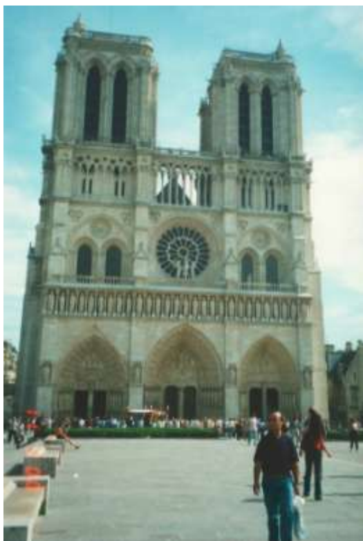
Западный фасад Собора, 2000 г.