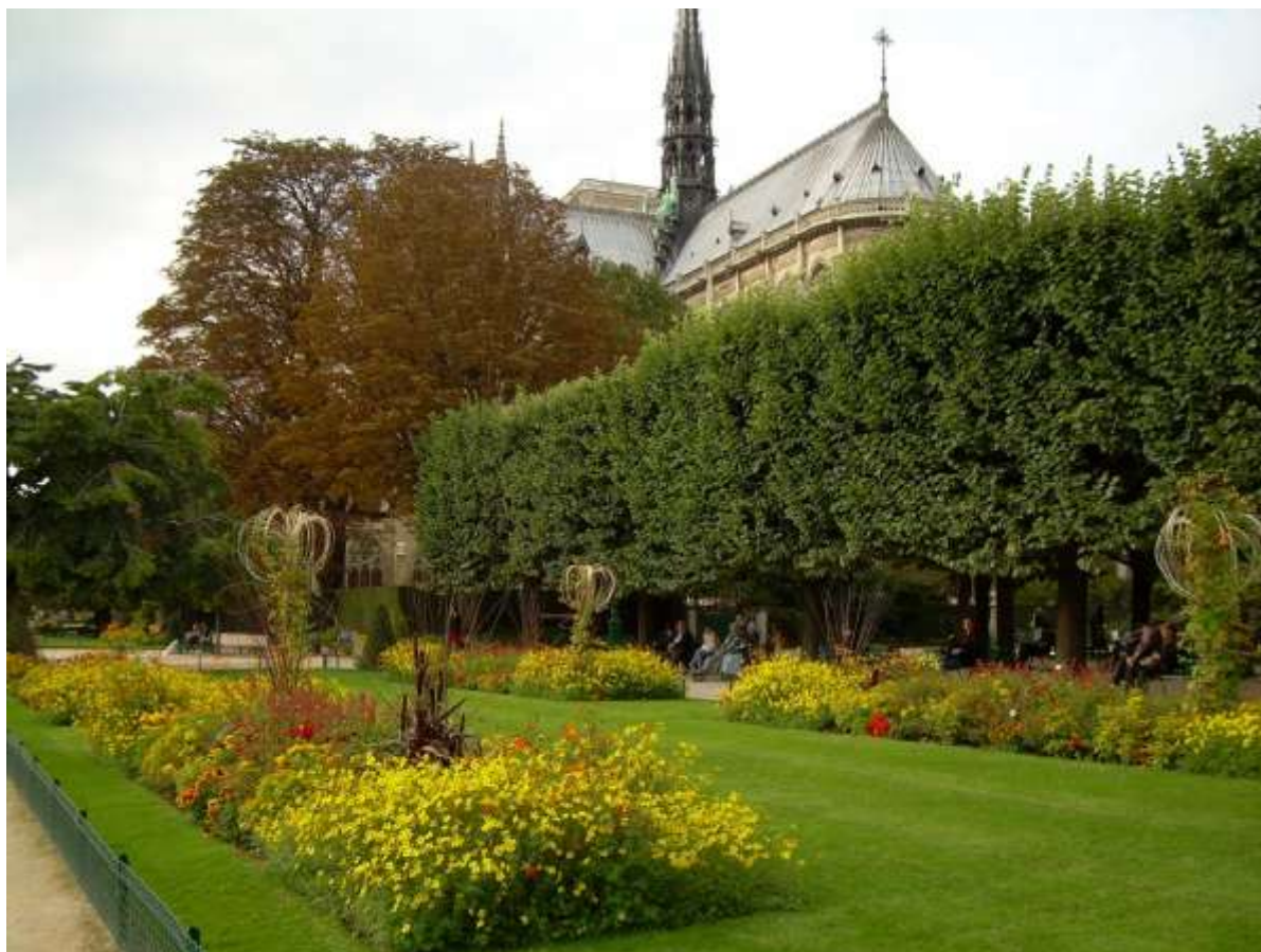
Парк у Собора