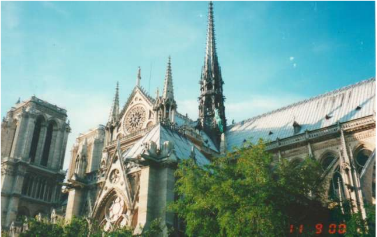
Химеры и горгульи