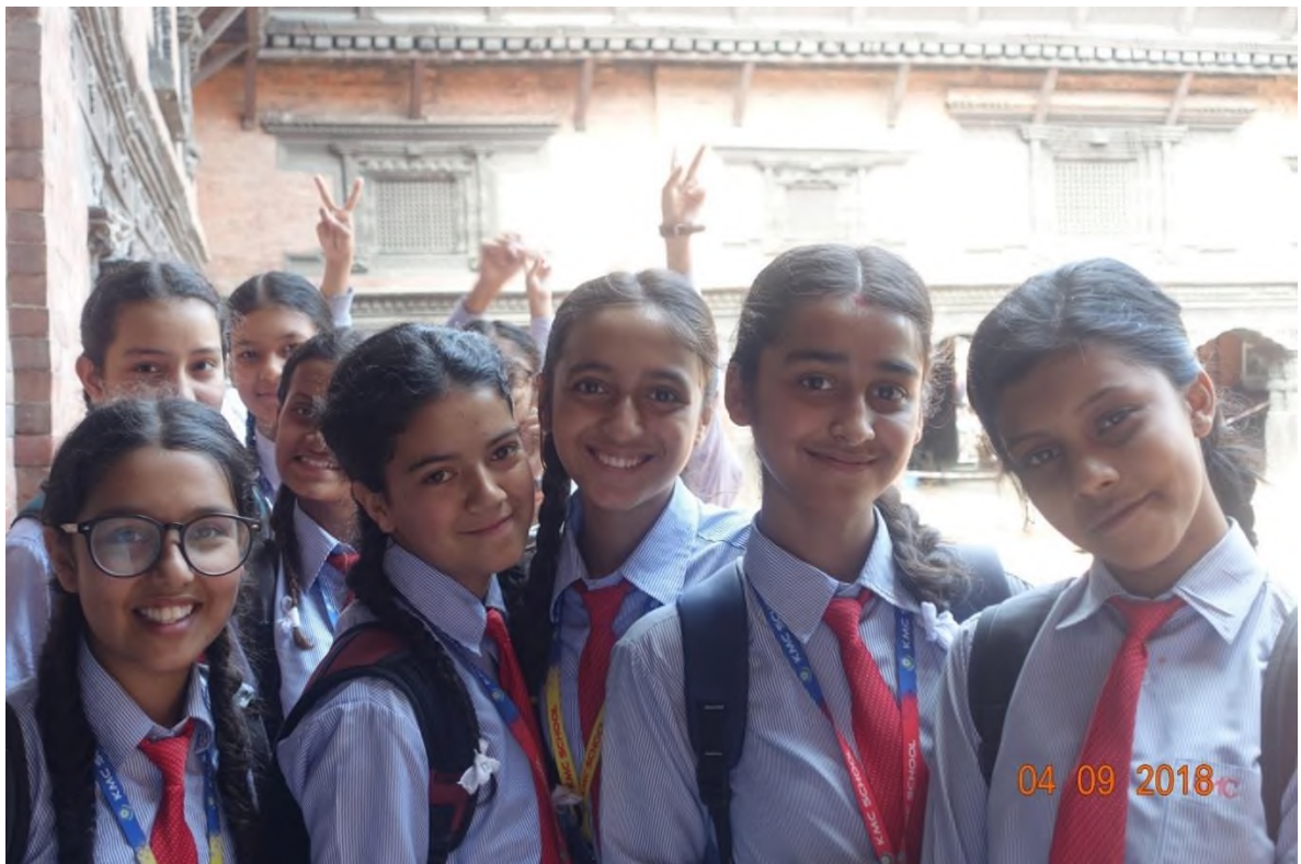
Девчонки-школьницы, которых мы встретили на выходе из музея индийской культуры, позировали с огромным энтузиазмом.