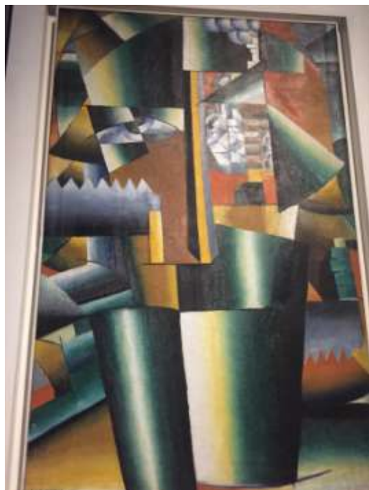
К. Малевич. Усовершенствованный портрет Ивана Клыча