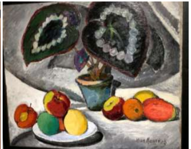
Не могла оторваться от натюрмортов Ильи Машкова . Особенно хороши рыбы.