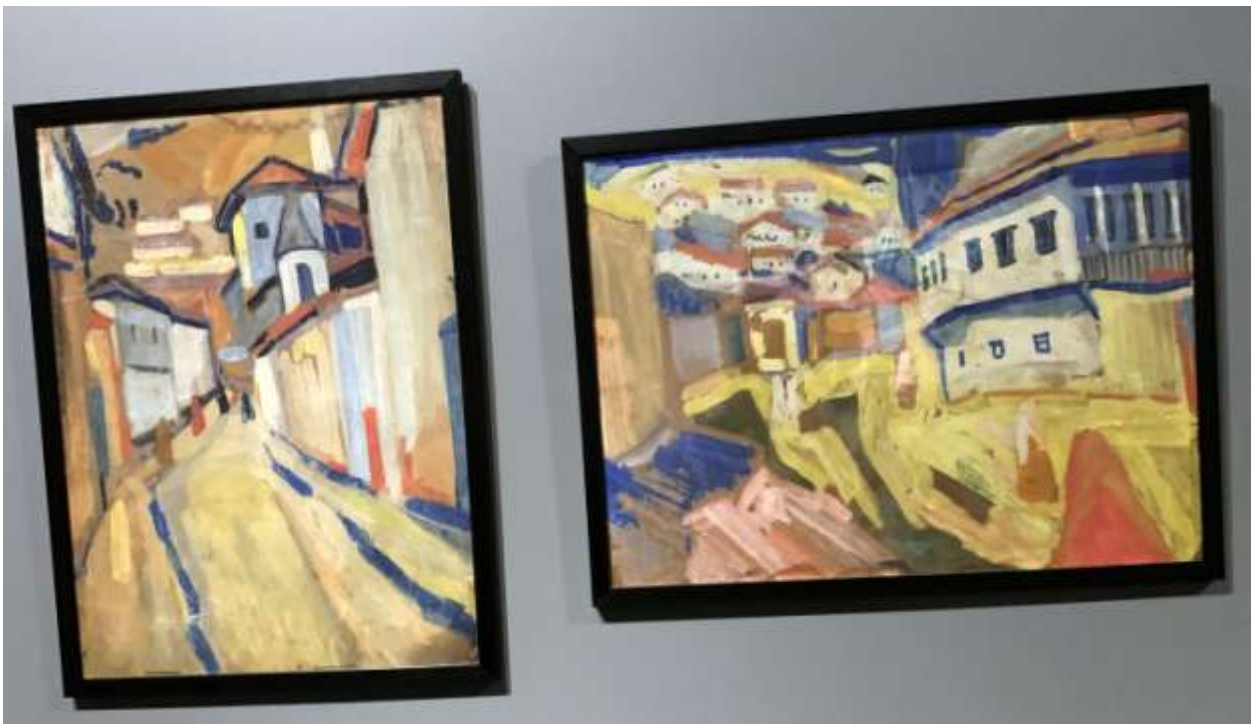
И. Школьник. Виды Бахчисарая