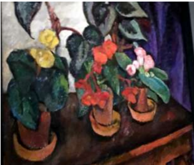
П. Кончаловский. Бегонии. Справа - Матадор