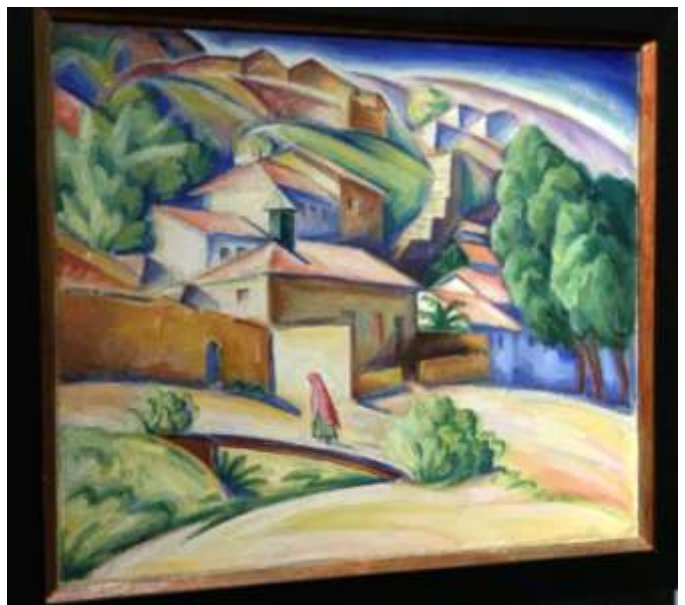
Ц. Шлейфер. Бахчисарай