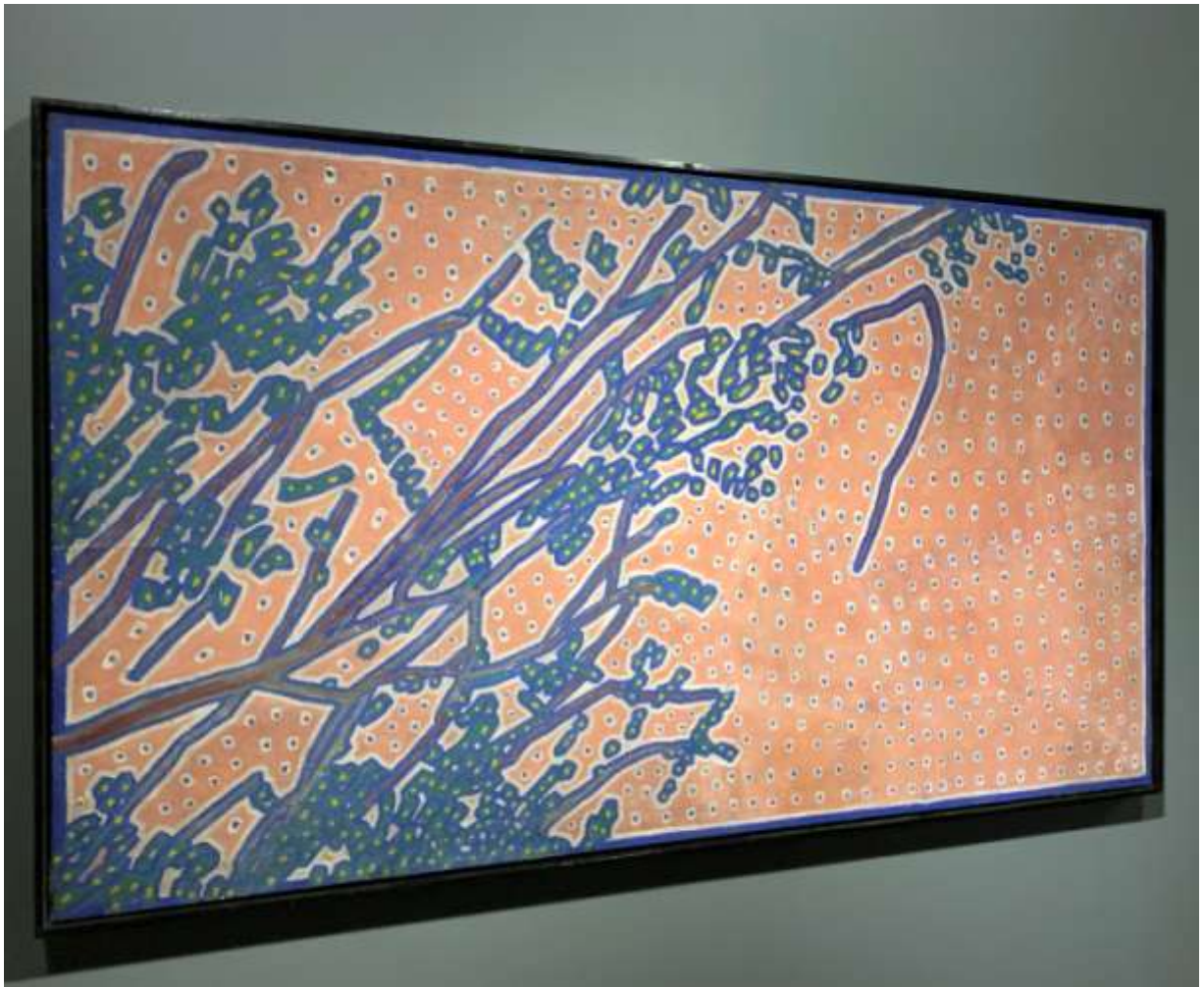
Д. Бурлюк. Весна