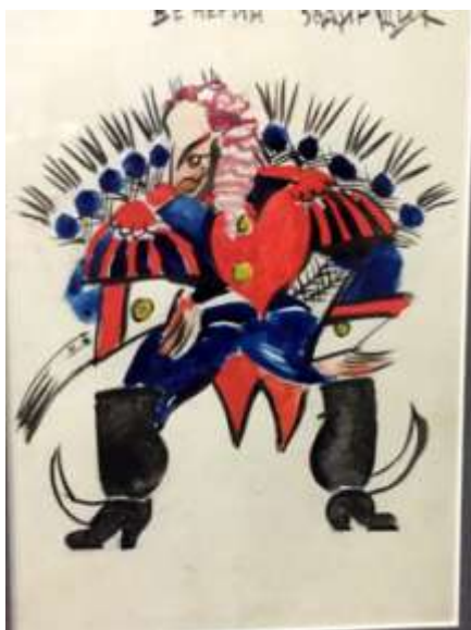
В. Татлин. Эскиз костюма Венериного задирищика к спектаклю «Царь Максемьян и его непокорный сын Адольф»