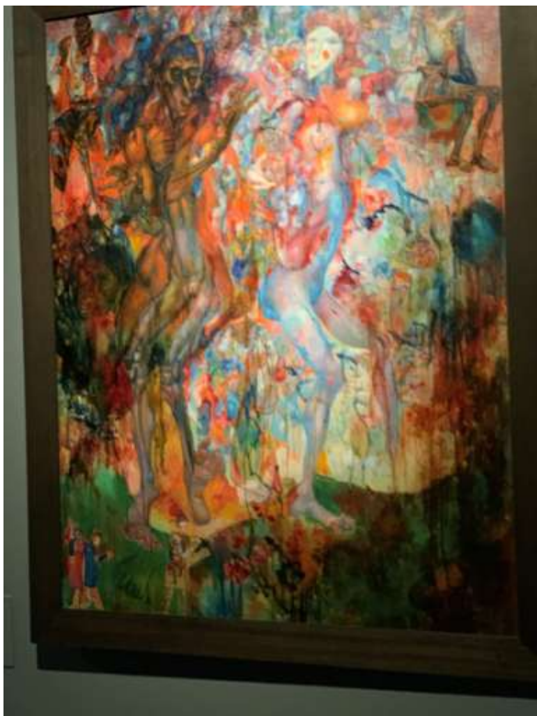
П. Филонов. Мужчина и женщина