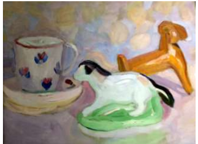
Елена Гуро. Скандинавская царевна Утро великана (справа)

Елена Гуро известна не только как художница, но и как талантливая поэтесса, она выпустила несколько сборников стихов, но рано ушла из жизни. Она была замужем за Михаилом Матюшиным, вместе они вошли в «Союз молодых».