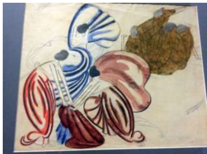
В. Бубнова. Купальщицы