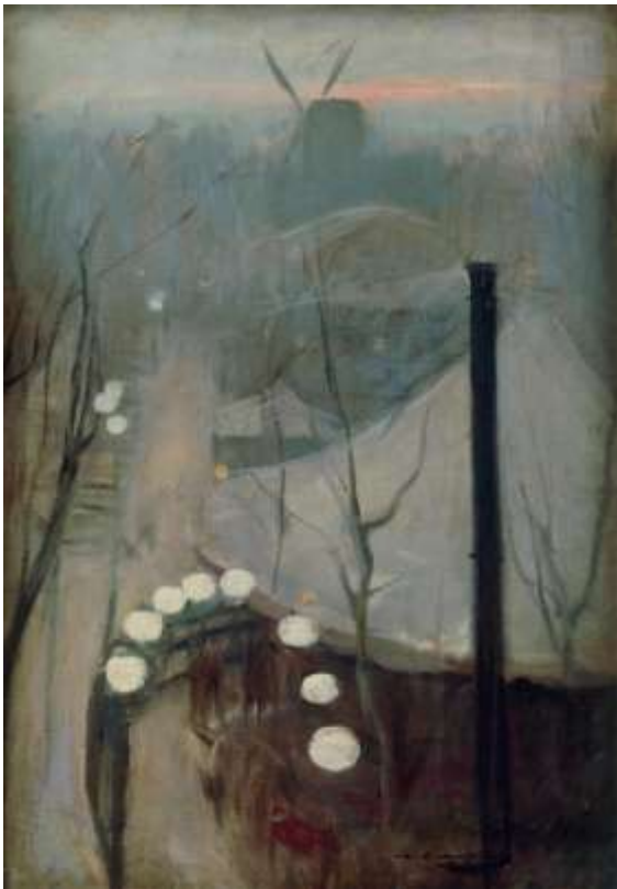
Вверху: Пере Изерн . Париж Справа: Рамон Казас . На открытой террасе Внизу: Эрмен Англада-Камараса . Белый павлин. Эти картины привезли из Музея Кармен Тиссен-Борнемиса, Мадрид

Я почти не фотографировала, потому что благодаря приложению Rusimp по ссылке http://spain.rusimp.su/ можно посмотреть довольно много картин с этой выставки.