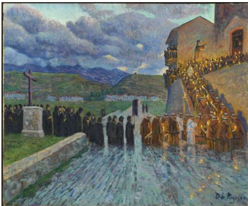
Дарио де Регойос. Процессия капуцинов в Фуэнтеррабии