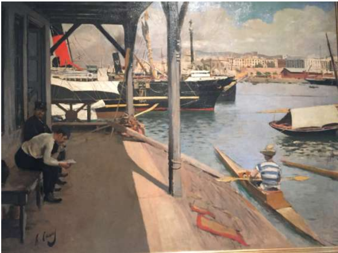
Рамон Казас. Барселонский яхт-клуб