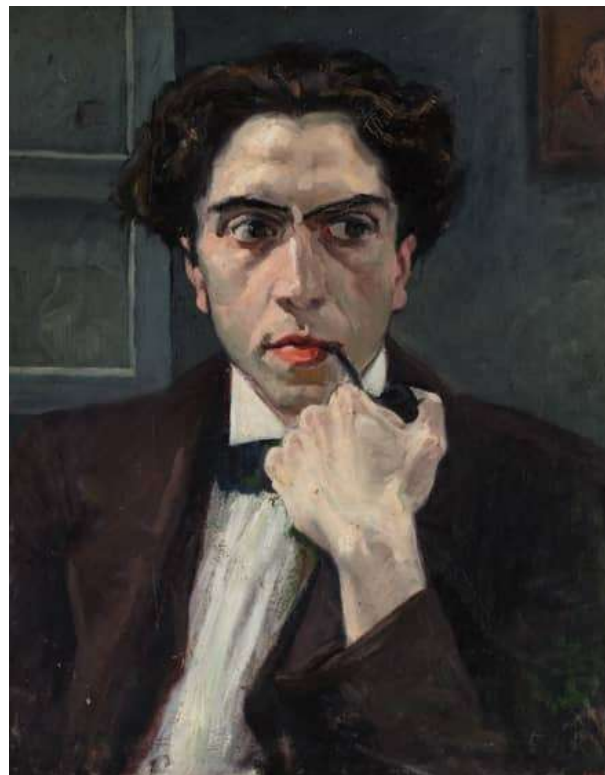
Мариан де Пиделасерра. Портрет Эмили Фонбони