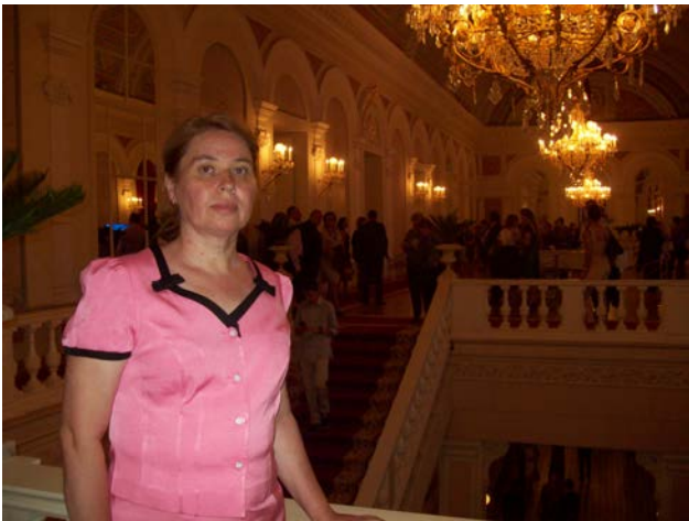
В Большом театре