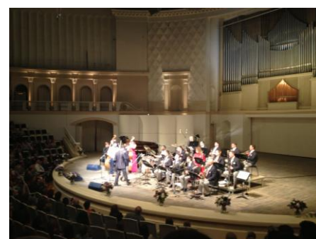
Молодежь на сцене