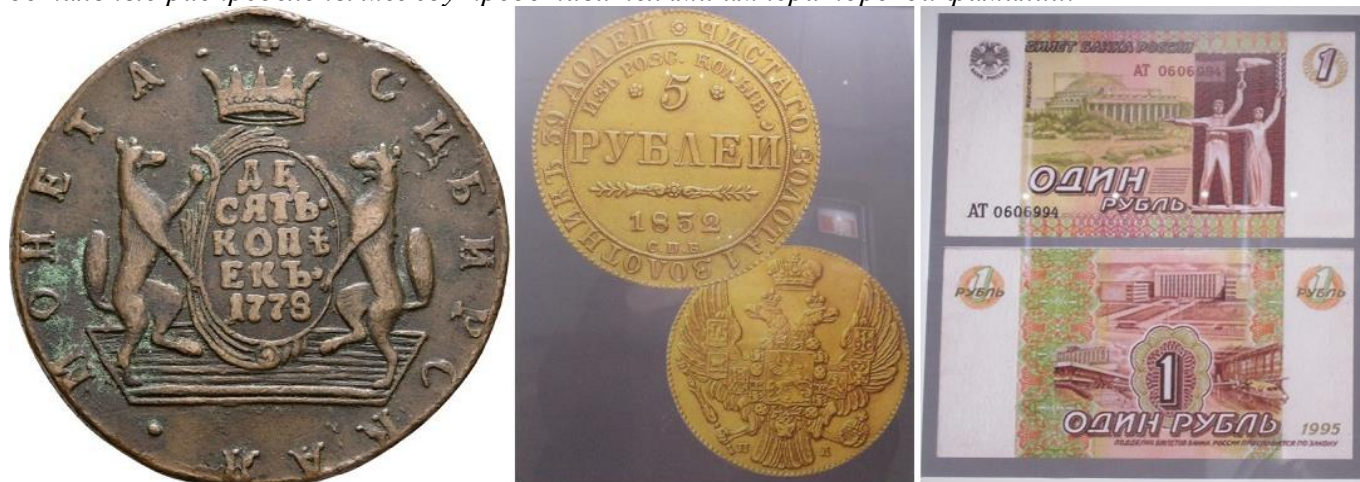
Вверху справа эскизные проекты купюры 1995 года с изображением Новосибирска.

Было отчеканено всего 1000 таких монет, из которых 50 были преподнесены Николаю I, а остальные распределены между представителями императорской фамилии.