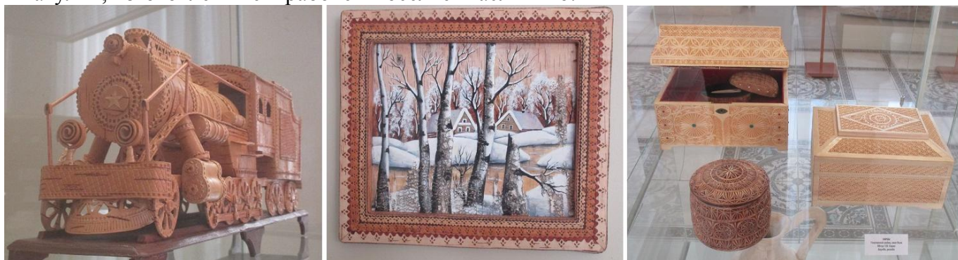
Маслянинских берестяных изделий на выставке много.

Я довольно равнодушна к изделиям из бересты . Но просто пройти мимо не смогла, так как на выставке новосибирских мастеров берестяные работы тоже присутствовали. На левой нижней картинке сувенирный “Паровоз” из Барабинска. В центре – картина “Зимний пейзаж”, выполненная мастером из Колывани (роспись на бересте). На правой картинке берестяные шкатулки, изготовленные в рабочем поселке Маслянино.