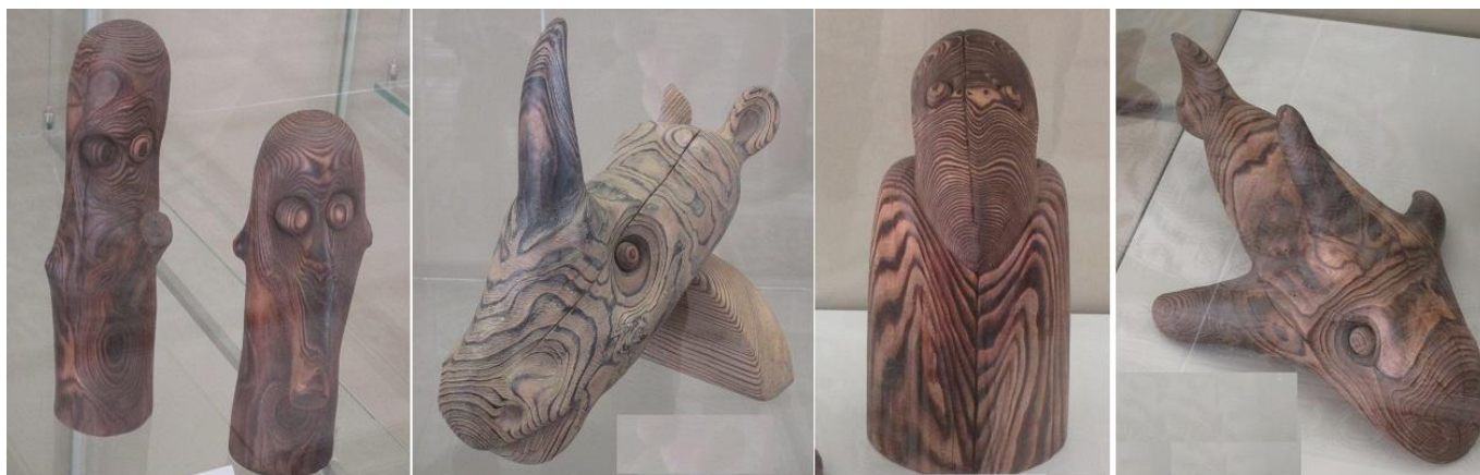
На верхних картинках “Караканчики” Д. Ушакова и “Влюбленный носорог”, “Хранитель времени” и “Дегустатор креветок” И. Гриценко.

Сортируя свои впечатления, подкрепленные фотографиями, обнаружила и еще работы Дома ремесел “Слобода” из Колывани . На левой нижней картинке шкатулка “Сундук”, выполненная из глины. На центральной и правой картинках – матрешки “Хлеб и соль” и “Жили-были”. Для изготовления матрешек использовалось неведомое мне шликерное литье .