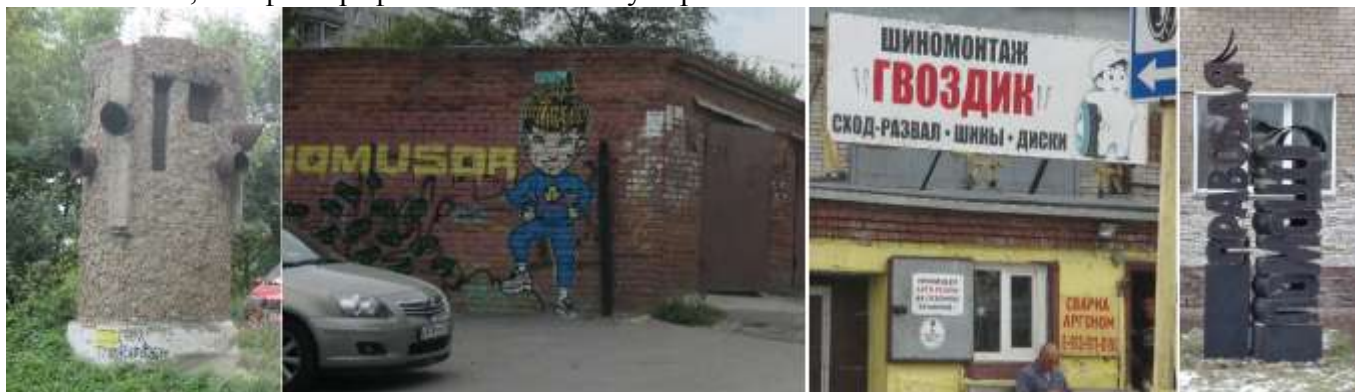
Вот как-то так выглядит улица Линейная в Новосибирске

Далее качок в синем спортивном костюме (или это неведомый мне киноперсонаж), украшающий стену гаражного кооператива. На третьей слева картинке вывеска шиномонтажной мастерской с символическим названием – нежно так, ГВОЗДИК. Самую правую картинку пришлось взять в интернете. Я подошла к этому декоративному сооружению “Правовая помощь”, установленному рядом с адвокатским кабинетом “Истеблишмент”, но почему-то развернулась и ушла. И уже дома спохватилась, что фотографии-то нет! Потому карточка ЗИМНЯЯ.