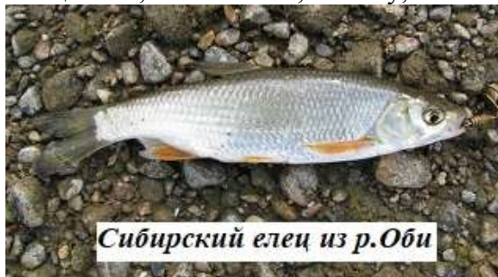
Сибирский елец из р.Оби

По Новосибирску протекают ТРИ речки Ельцовки . И только берегами одной из них названы улицы города – Ельцовки 1-й . При этом Первую Ельцовку считают самой “скромной” Ельцовкой, в частности, потому, что она коротка (10 км), не имеет притоков (точнее, есть один, но безымянный). Изначально речка, целиком протекающая по городу (Калининский, Дзержинский и Заельцовский районы), называлась Малой Ельцовкой. Считается, что название Ельцовка происходит не от дерева ЕЛЬ , а от рыбки ЕЛЕЦ ( https://iilane1.livejournal.com/11498.html ).