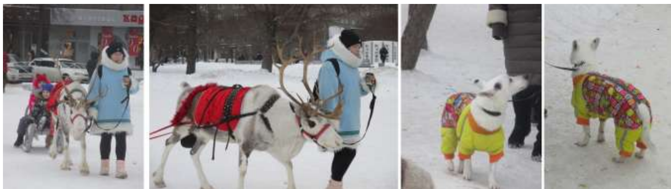
Вверху гужевой транспорт и одна из прогуливающих собак в карнавальном наряде.