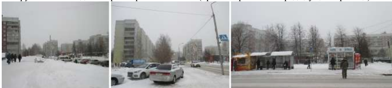
Жилые дома на Демакова строились в конце 1970-х и в 1980-е годы, все они однотипны.

долгое время был одним из двух ТЦ в нижней зоне Академгородка (вторым, я считаю, был Дом быта на Героев Труда). Теперь, конечно, всех победил по популярности, объемам и посещаемости Торгово-развлекательный комплекс “Эдем”. Тут же на повороте улицы в жилую часть я обнаружила Новогодний вариант рекламы жилья (правая картинка на предыдущей странице).